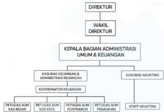
Gambar 1. Struktur Organisasi Keuangan